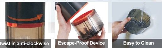
twist in anti-clockwise

Partition plates closing Preventing mosquitos from escaping